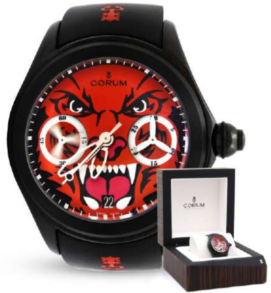
Lote 86 RELOJ CORUM BUBBLE "ESCUADRÓN TIGRE" REF.08.0022, 47MM, CRONÓGRAFO MONOPULSANTE, CIRCA 2020.

Versión reciente, con doble esfera de segundero y registro de cronógrafo, fechador, caja en acabado DLC (Diamond - like Carbón) edición limitada a 88 piezas (0X/88) serie 2362XXX. Maquinaria con calibre suizo original, con estuche en madera de palisandro original, con certificado y papeles.