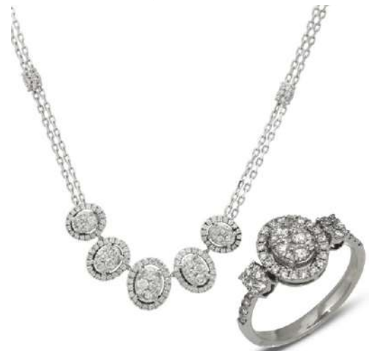
Lote 88 COLLAR Y ANILLO CON 250 DIAMANTES, ORO BLANCO 14K.

Diseño oval, las gemas corte completo, color H, claridad VS, peso aprox. en conjunto 3.0 Qtes., medida de la cadena 44 cm, medida anillo #6 ½, peso total 12.6 grs.