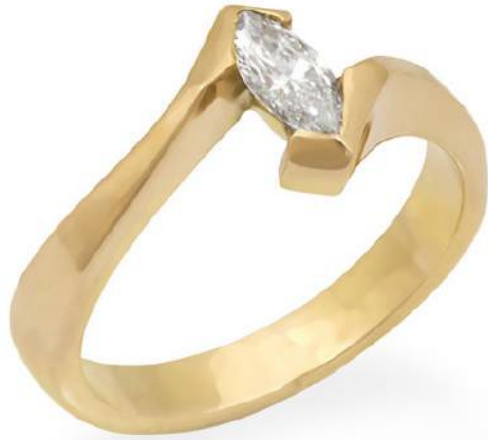
Lote 85 ANILLO SOLITARIO CON DIAMANTE CORTE MARQUIZ PESO APROX. 0.30 QTE. COLOR K, CLARIDAD SI.

Diseño abierto, oro 14k, medida #9 ½, peso 5.9 grs.