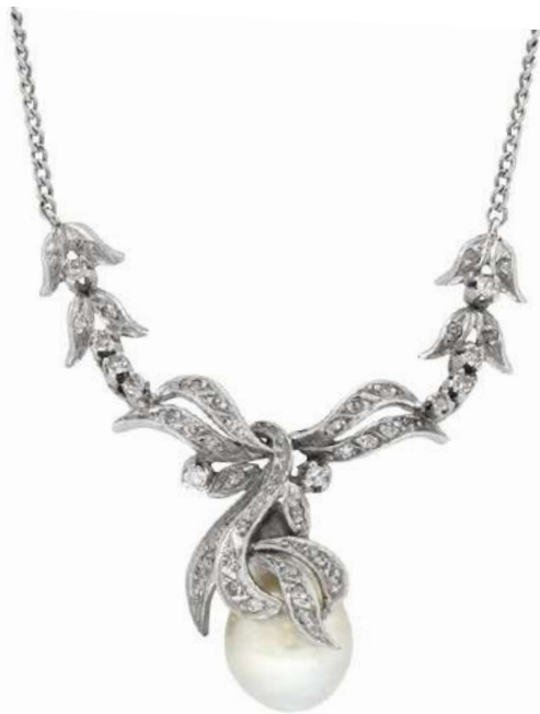
Lote 87 COLLAR CON PENDENTIF, ORO BLANCO 14K, CON PERLA AUSTRALIANA ACINTURADA, COLOR GRIS ARMÓNICO CREMA Y 44 DIAMANTES.

Los brillantes corte 8 x 8, color K, claridad SI, peso aprox. en conjunto 0.30 Qte., medida 42 cm, peso 13.0 grs.